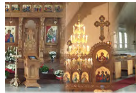
Biserica in anul 2019