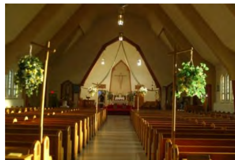
Biserica in anul 2007